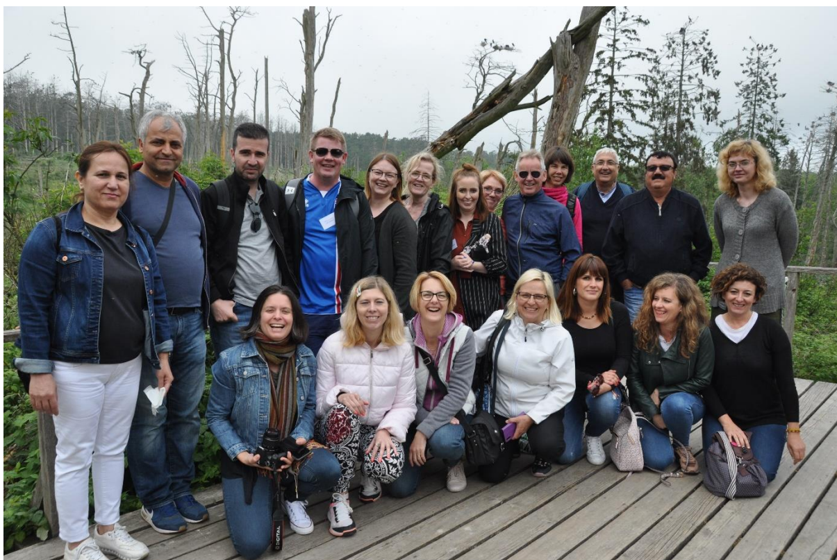
Skupinska fotografija vseh gostujočih učiteljev v Litvi