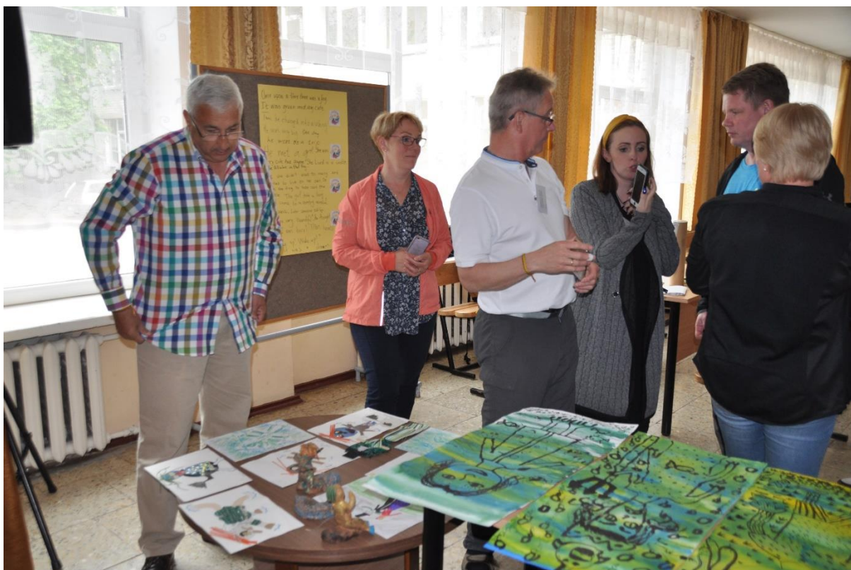
Razstava izdelkov naših učencev