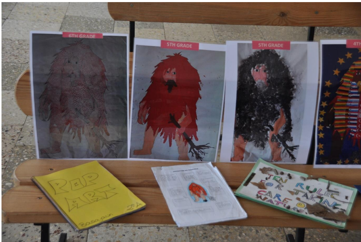
Razstava izdelkov španskih učencev