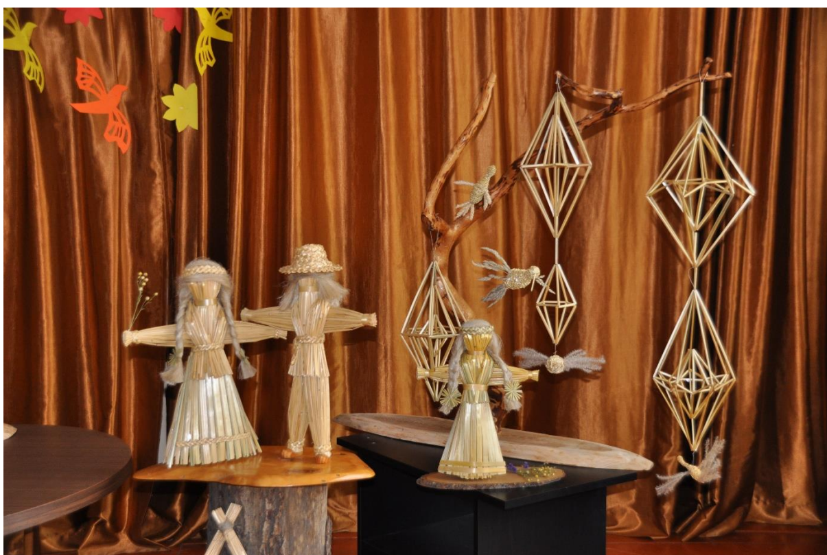
Izdelki iz slame