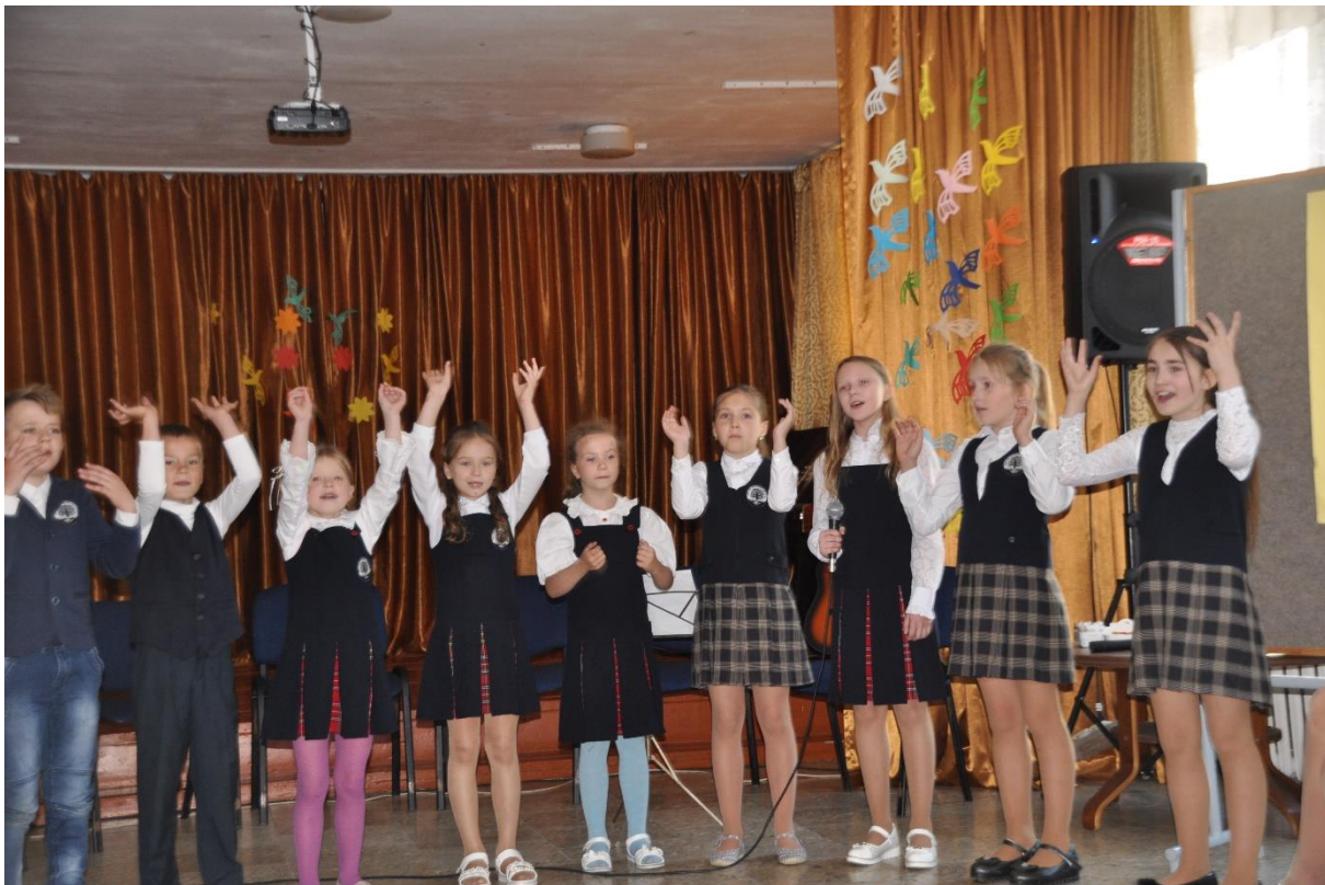
Prireditev na osnovni šoli