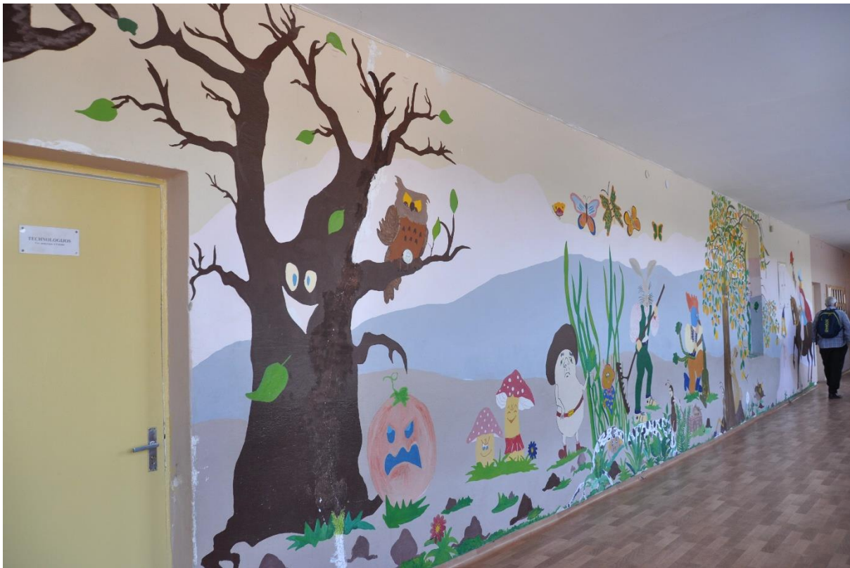
Poslikani šolski hodniki