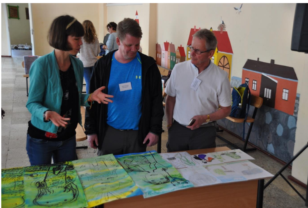
Razstava izdelkov naših učencev